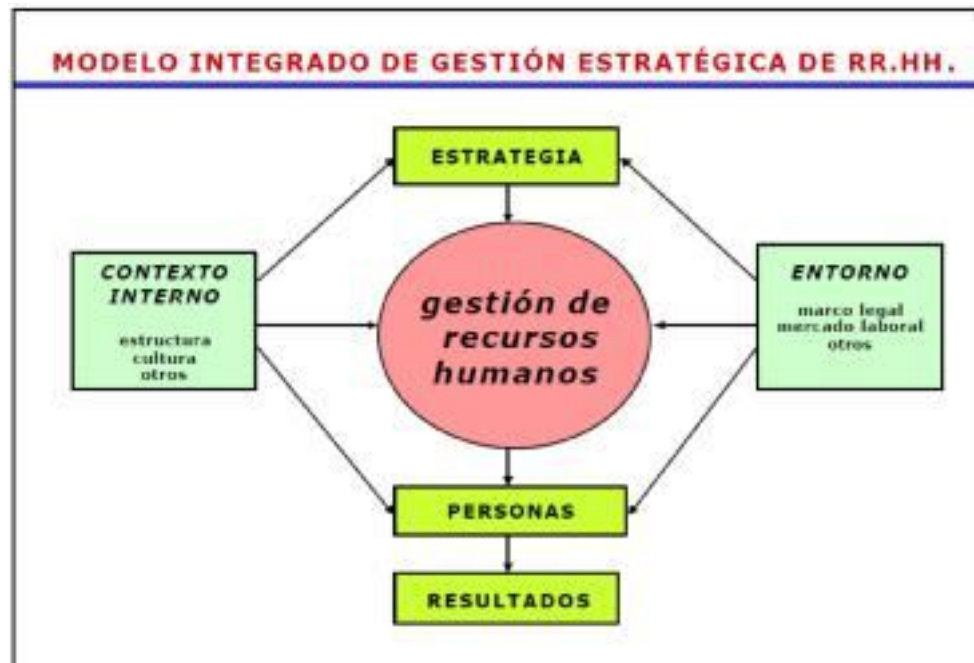
Figura N° 1. Modelo Integrado de Gestión Estratégica del Recurso Humano adaptado de Serlavós, tomado de: (Longo, 2002 pág. 11)

Es un sistema integrado de gestión, cuya finalidad básica o razón de ser es la adecuación de las personas a la estrategia institucional (Longo, 2002. pág. 13.). El éxito de la Planeación Estratégica del Recurso Humano, se da en la medida en que se articula con el Direccionamiento Estratégico de la Entidad (misión, visión, objetivos institucionales, planes, programas y proyectos). Por consiguiente, dicho modelo consta de lo siguiente: